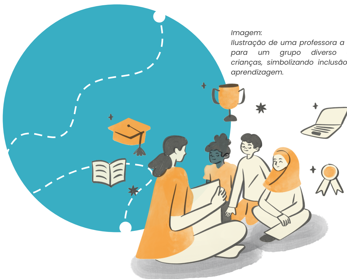
Imagem: Ilustração de uma professora a ler para um grupo diverso de crianças, simbolizando inclusão e aprendizagem.

Quando trabalhamos a diversidade e a inclusão desde os primeiros anos de escolaridade, estamos a contribuir para a construção de uma sociedade mais justa, empática e solidária. Crianças que crescem em ambientes inclusivos aprendem a respeitar e valorizar as outras, a resolver conflitos de forma construtiva e a sentir-se seguras para serem quem são.